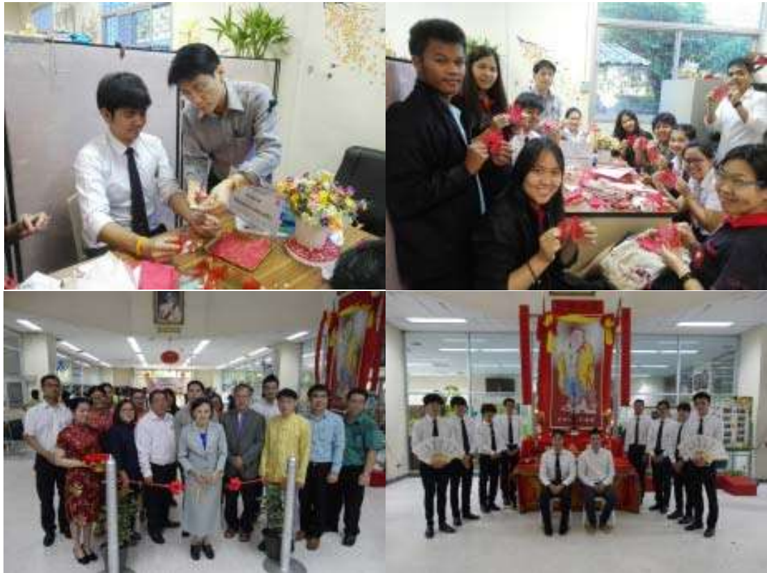
หลักสูตรศิลปศาสตรบัณฑิต